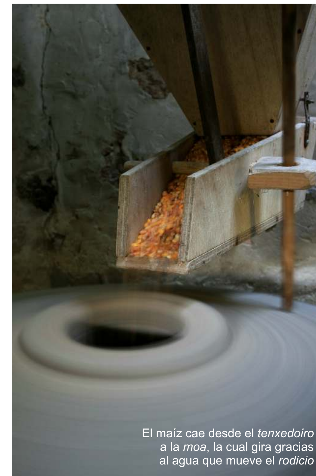
El maíz cae desde el tenxedoiro a la moa, la cual gira gracias al agua que mueve el rodicio