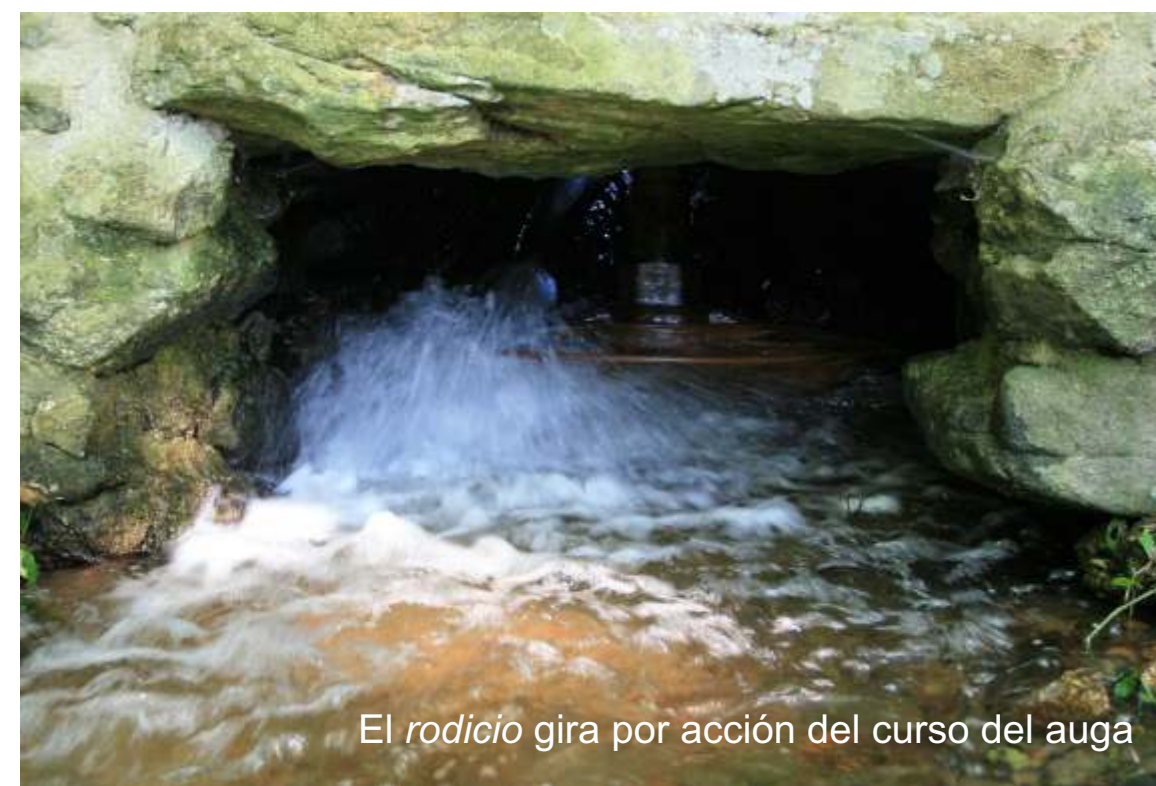
El rodicio gira por acción del curso del agua